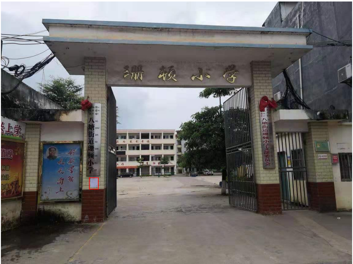
图 3-9 第二次公示——港南区八塘镇班顿小学公示照片（2019 年 7 月 4 日，远景）