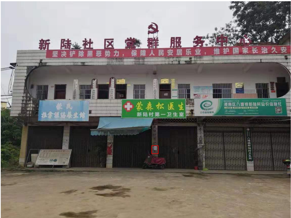
图 3-5 第二次公示——新陆村公示照片（2019 年 7 月 4 日，远景）