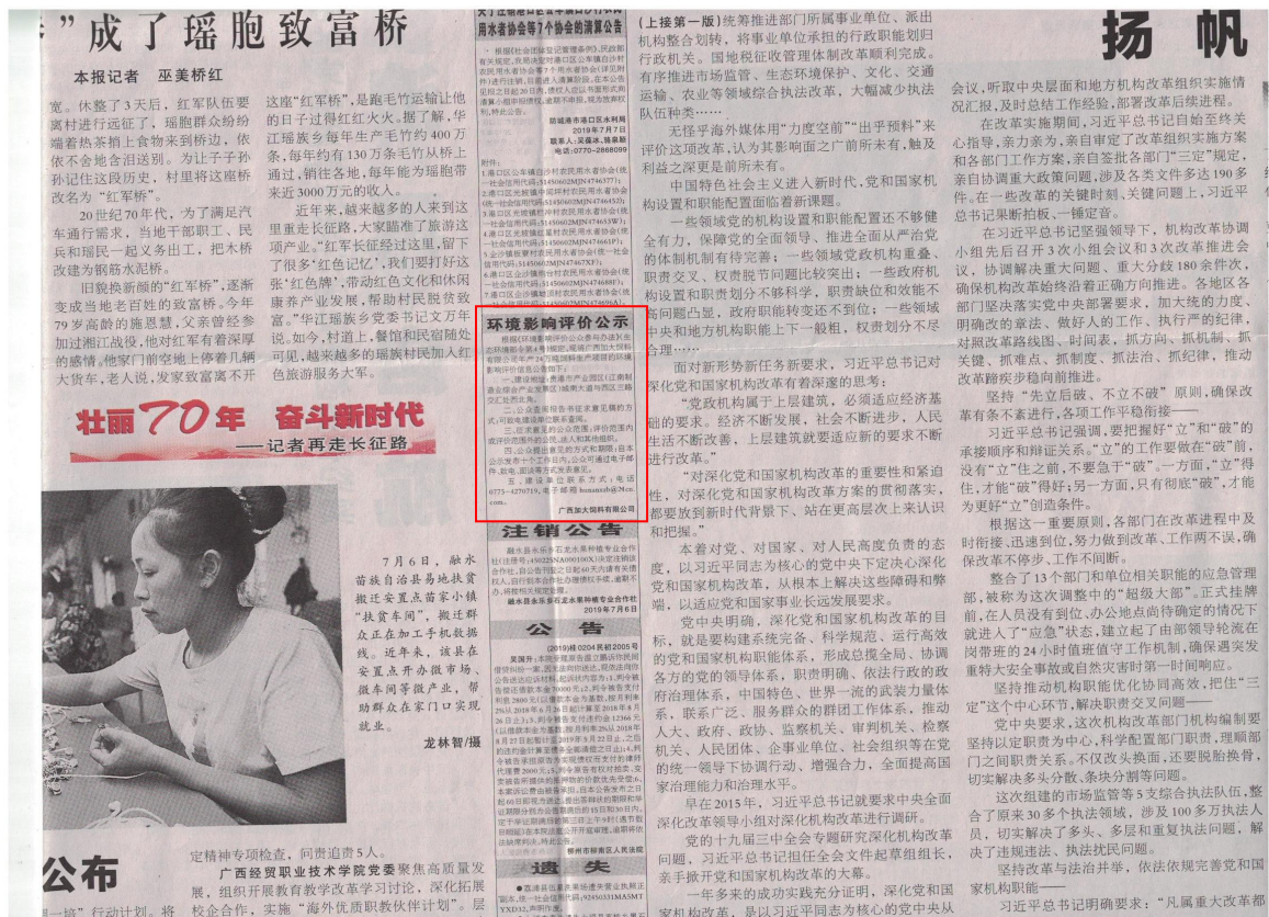
图 3-2 第二次公示——报纸公示照片（2019年7月7日广西日报）