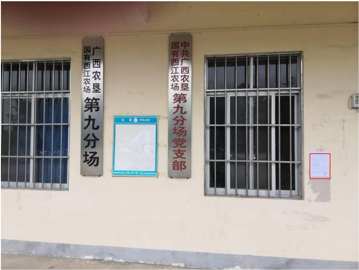
图 3-4 第二次公示——西江农场九队公示照片（2019 年 7 月 4 日，远景）