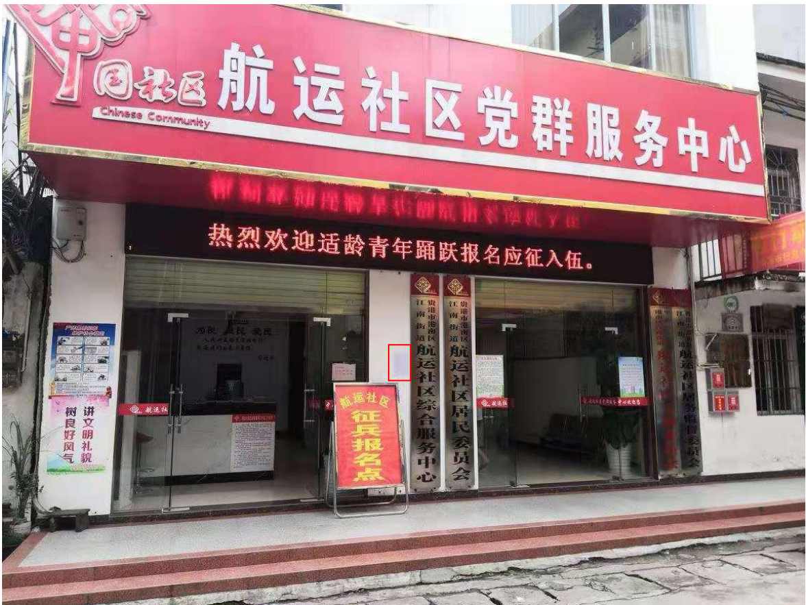
图 3-6 第二次公示——航运新村公示照片（2019 年 7 月 4 日，远景）