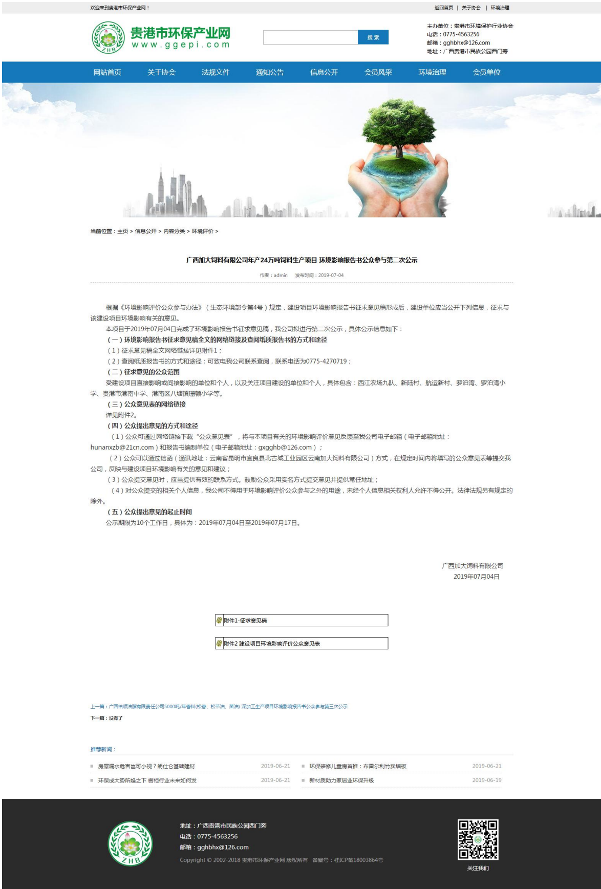
图 3-1 第二次公示——网络公示截图