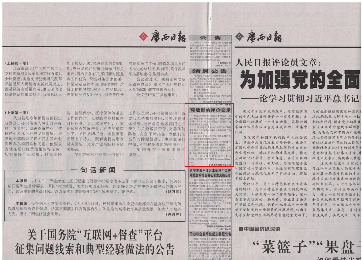
图 3-2 第二次公示——报纸公示照片（2019 年 7 月 6 日广西日报）

年7月7日在《广西日报》发布了第二次公示，广西日报是贵港市的主流纸媒，符合《环境影响评价公众参与办法》（生态环境部令第4号）的要求，报纸公示的照片见图3-2和图3-3。