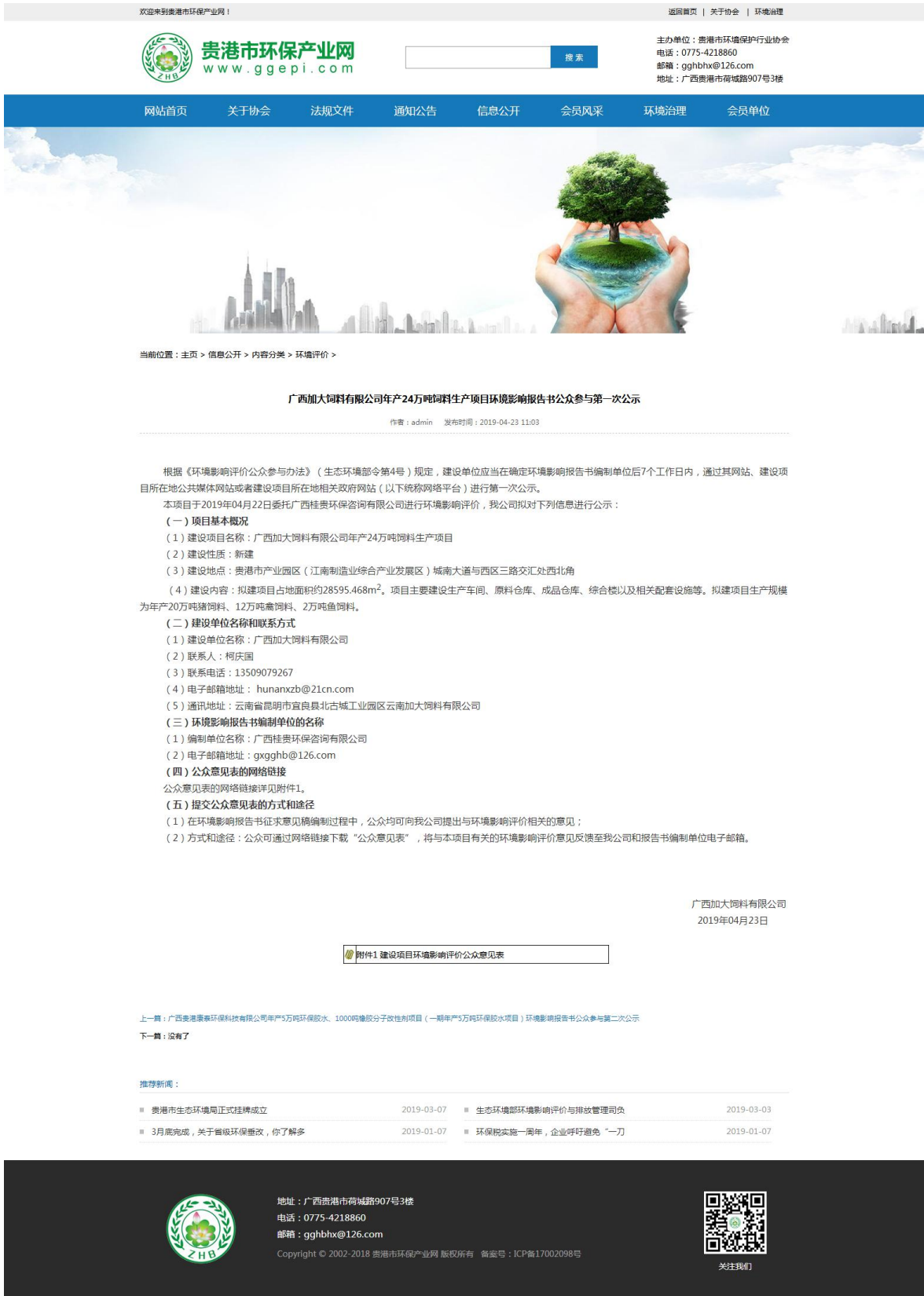
图 2-1 第一次公示——网络公示照片