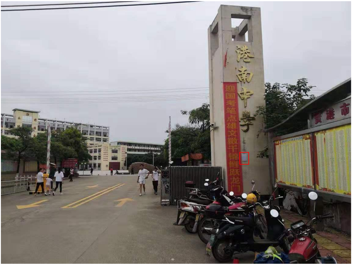
图 3-8 第二次公示——贵港市港南中学公示照片（2019 年 7 月 4 日，远景）