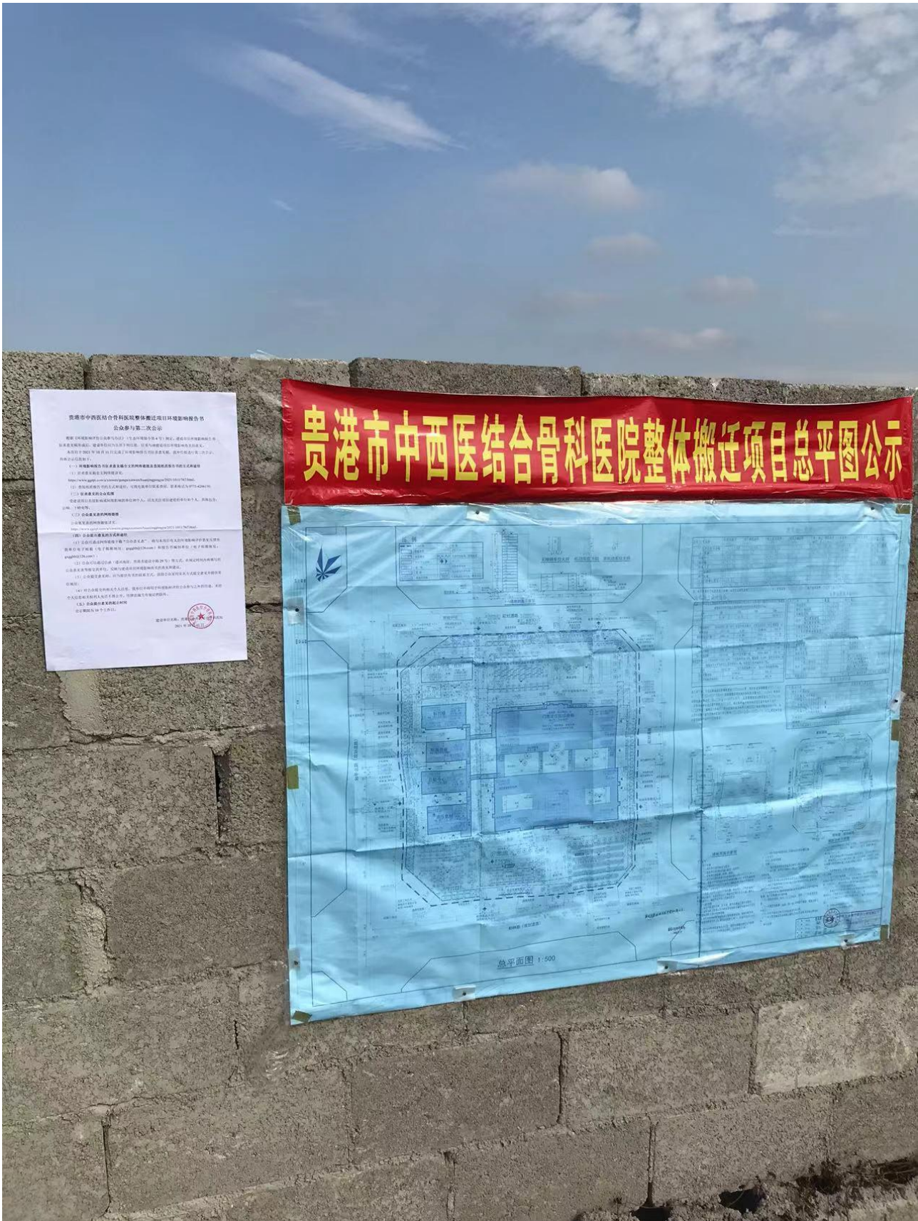
图 3-4 第二次公示——张贴公示照片（项目拟建地）