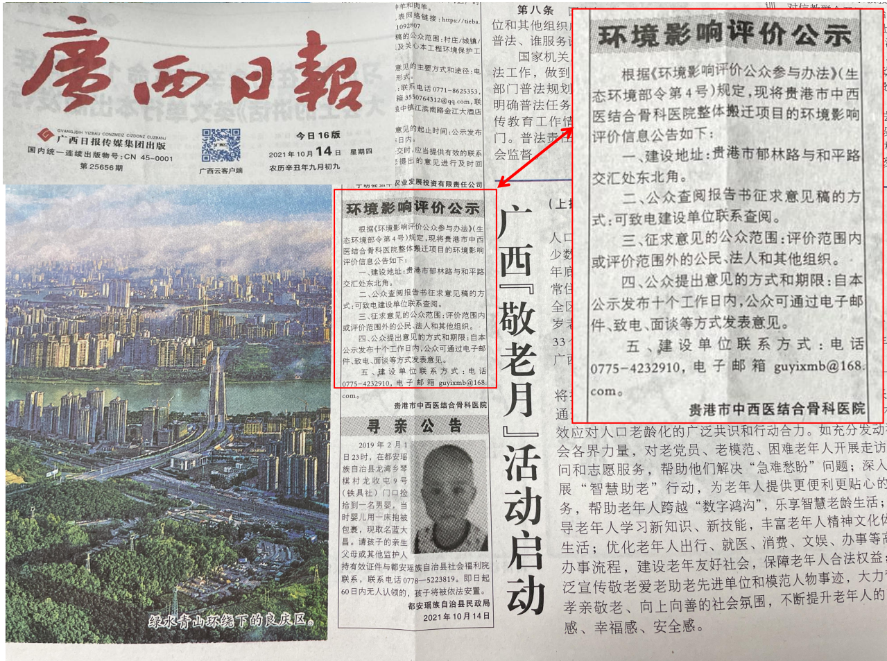
图3-2 第二次公示——报纸公示照片（2021年10月14日广西日报）

本项目的环境影响报告书征求意见稿形成后，我单位于2021年10月14日和10月15日在广西日报发布了第二次公示，符合《环境影响评价公众参与办法》（生态环境部令第4号）的要求，报纸公示的照片见图3-2和图3-3。