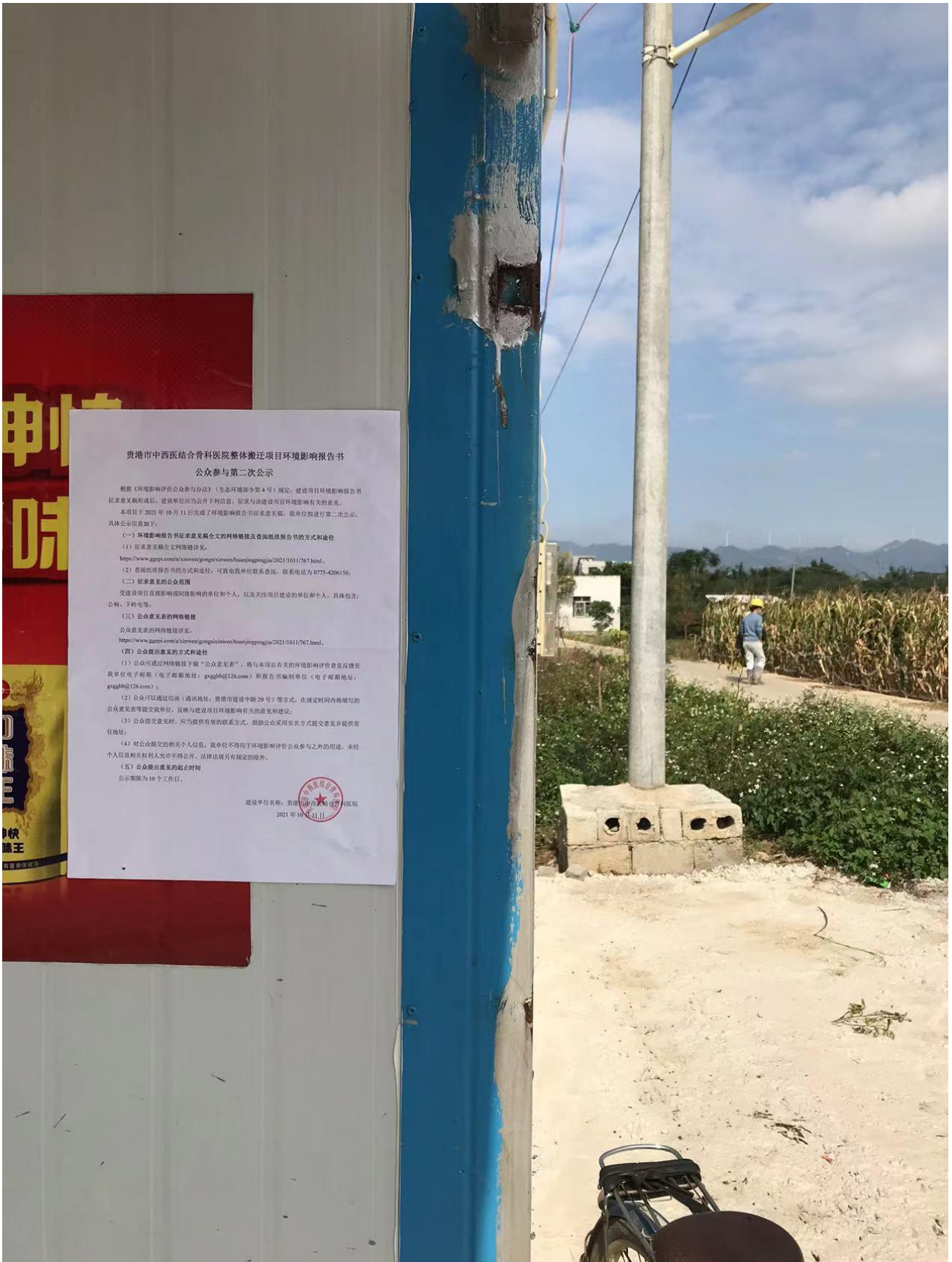
图 3-5 第二次公示——张贴公示照片（公响）