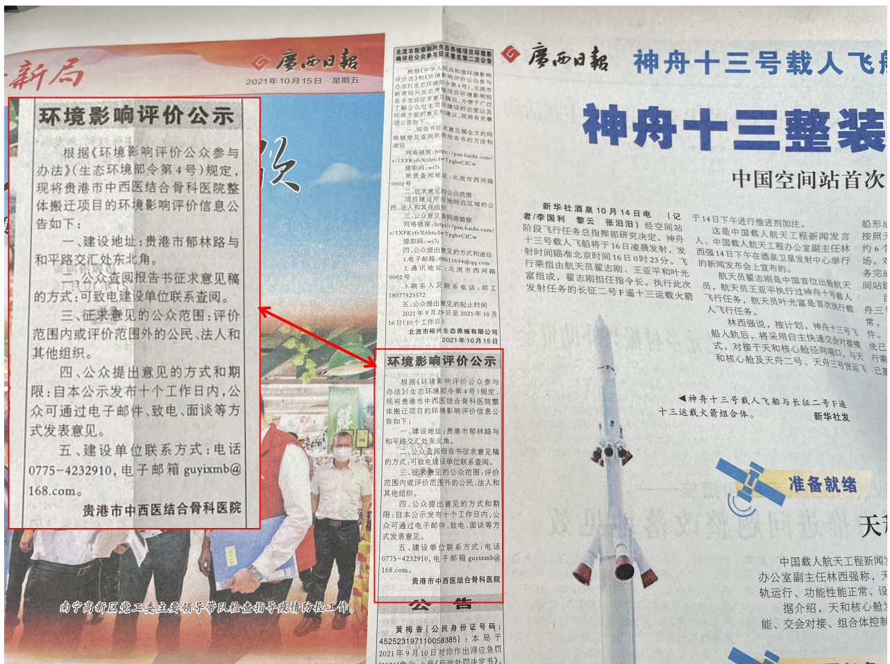
图 3-3 第二次公示——报纸公示照片（2021 年 10 月 15 日广西日报）