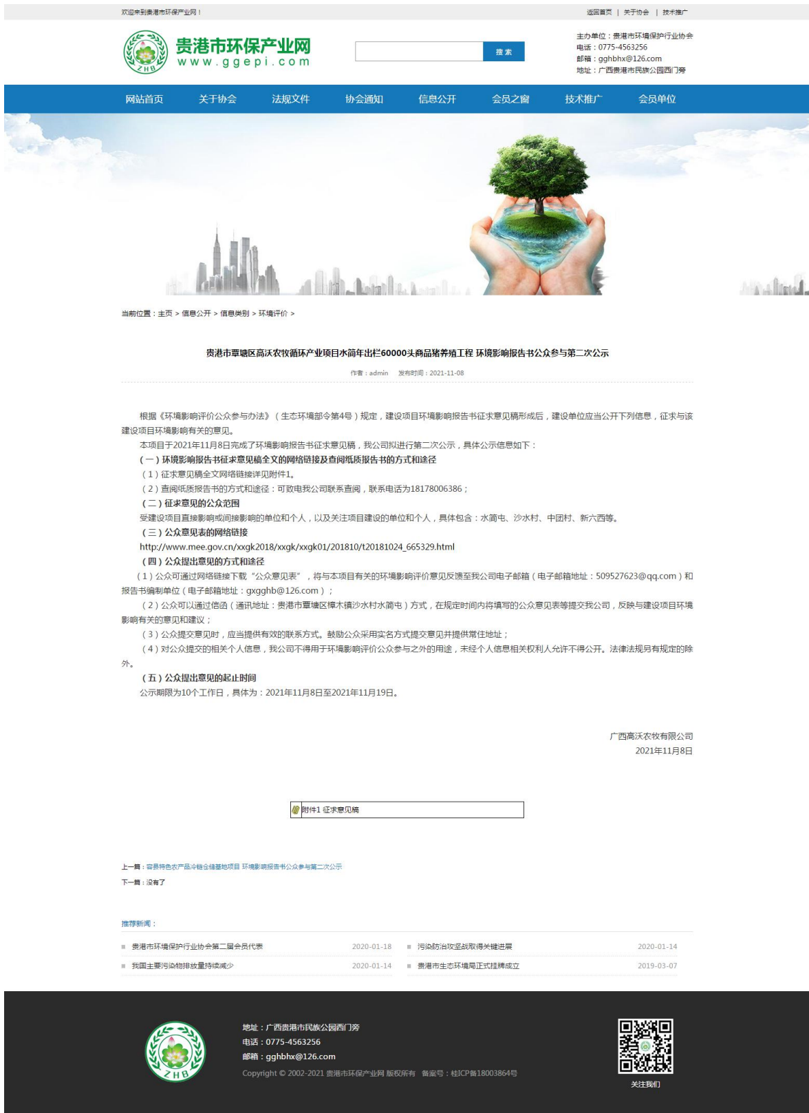
图 3-1 第二次公示——网络公示截图