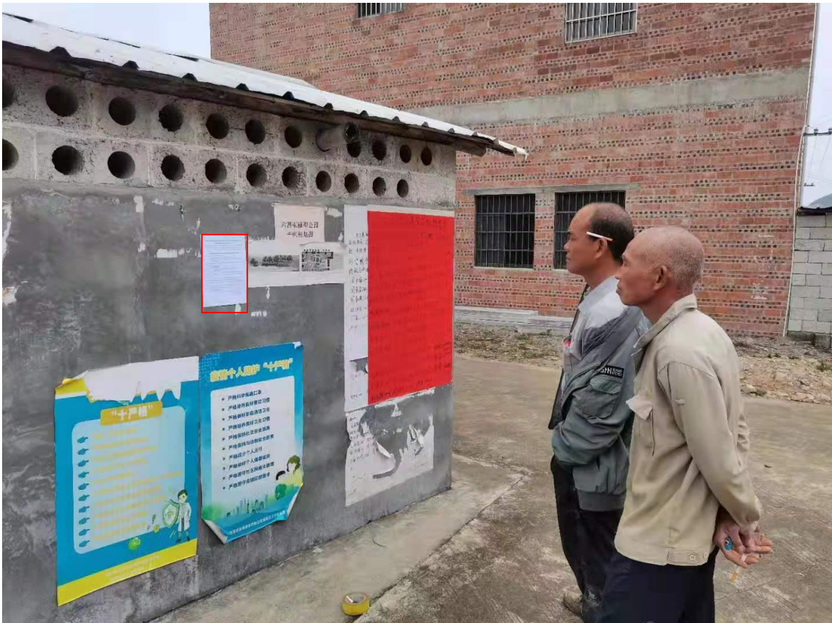
图 3-4 第二次公示——新六西公示照片（2021 年 11 月 15 日）

本项目的环境影响报告书征求意见稿形成后，我单位于 2021 年 11 月 15 日在水筒屯、沙水村、中团村、新六西张贴公告，水筒屯、沙水村、中团村、新六西均位于项目评价范围内，符合《环境影响评价公众参与办法》（生态环境部令第 4 号）。报纸公示的照片见图 3-4~3-7。