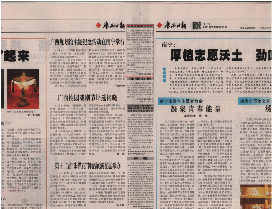
图 3-2 第二次公示——报纸公示照片（2021 年 11 月 16 日广西日报）