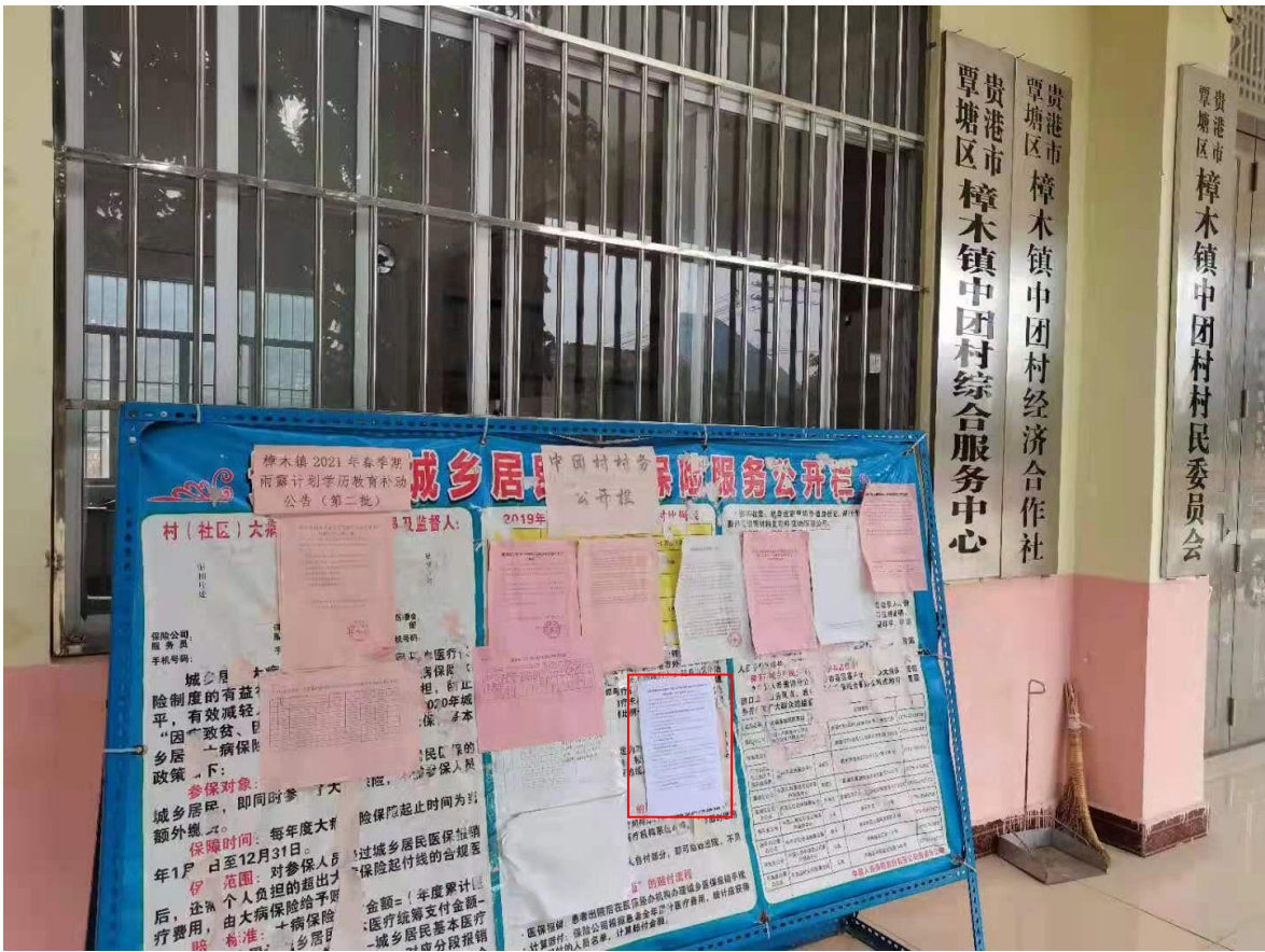
图 3-7 第二次公示——中团村公示照片（2021 年 11 月 15 日）