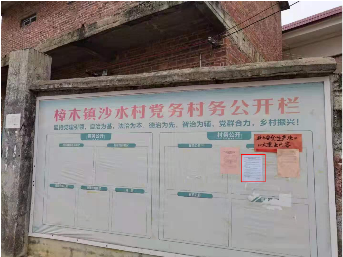
图 3-5 第二次公示——沙水村公示照片（2021 年 11 月 15 日）