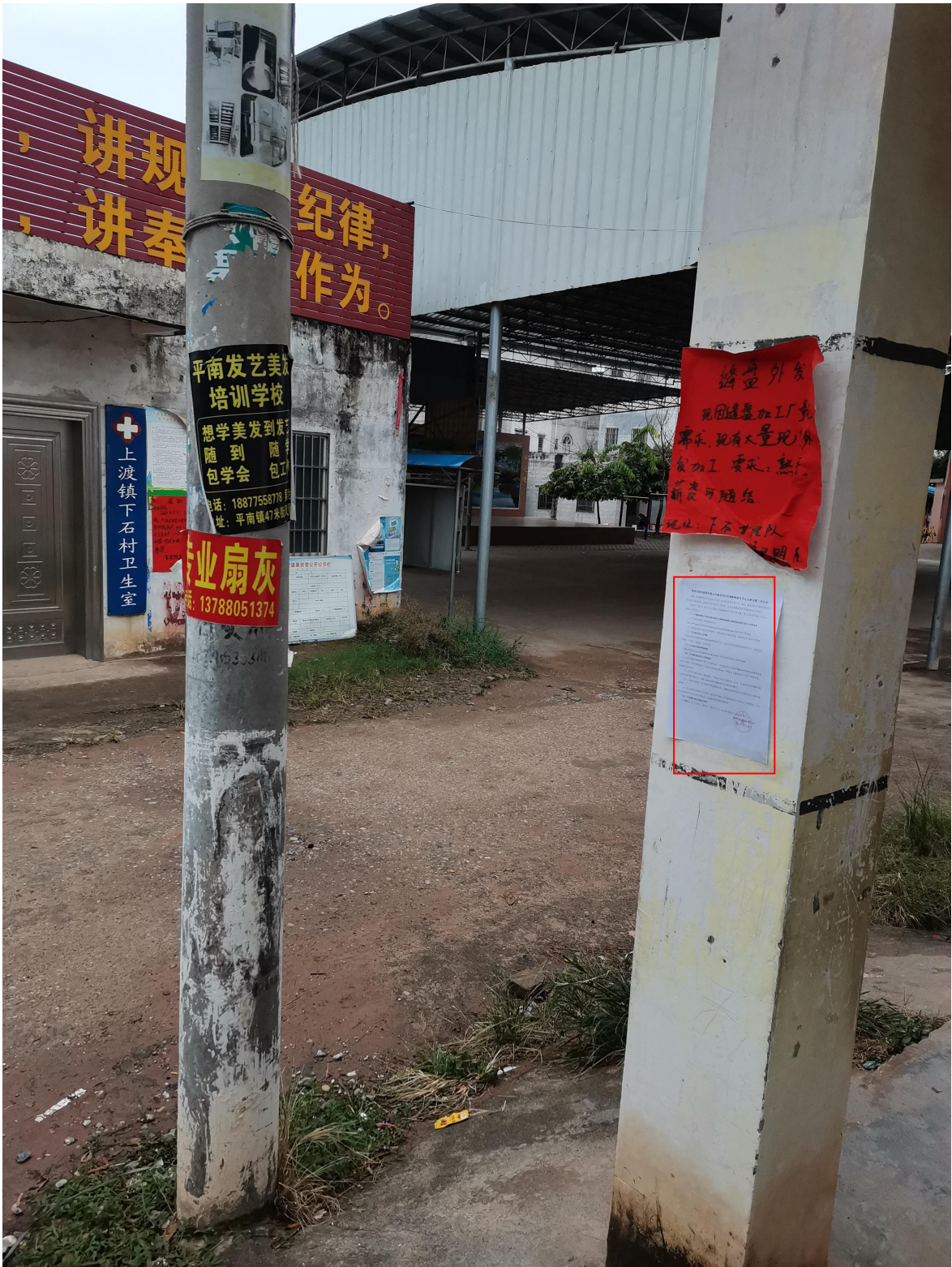
图 3-4 第二次公示——下石村公示照片（2021 年 10 月 15 日）