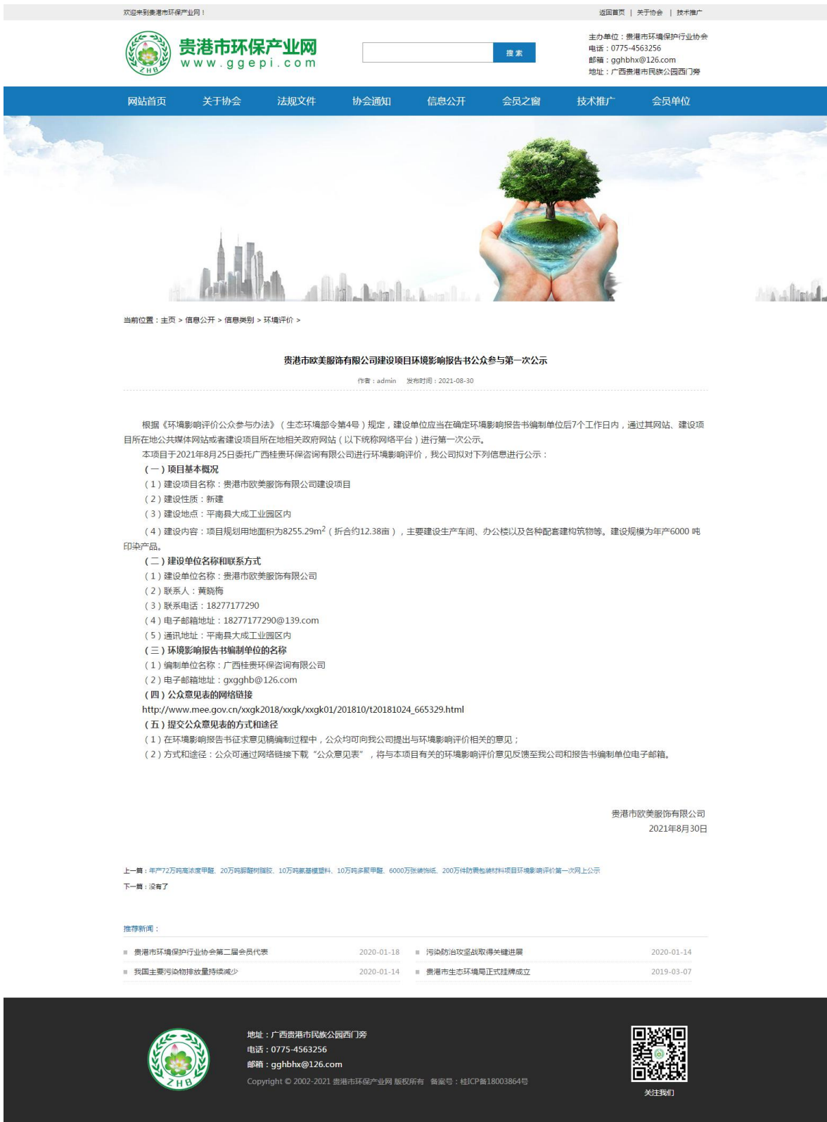
图 2-1 第一次公示——网络公示照片