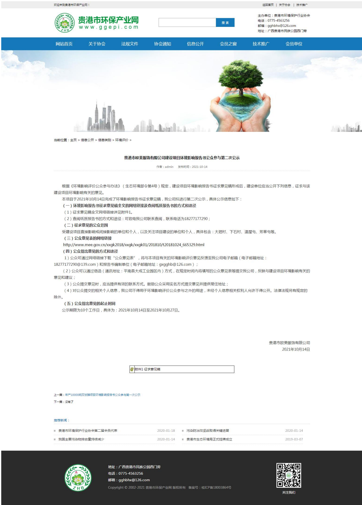
图 3-1 第二次公示——网络公示截图