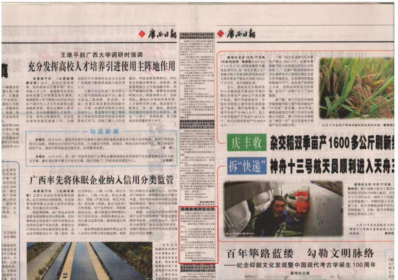
图 3-3 第二次公示——报纸公示照片（2021 年 10 月 18 日广西日报）