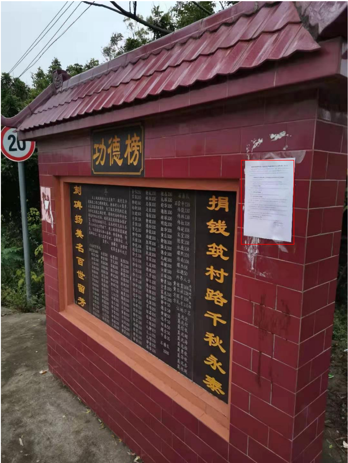
图 3-5 第二次公示——芳草屯公示照片（2021 年 10 月 15 日）