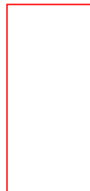
图 3-7 第二次公示——大垵村公示照片（2021 年 10 月 15 日）