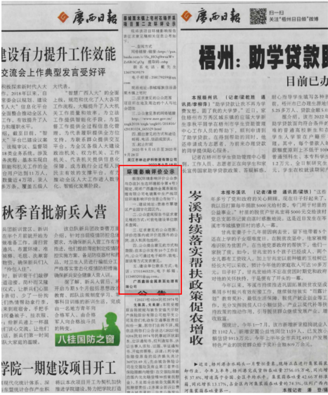
图 3-3 第二次公示——报纸公示照片（2022 年 9 月 18 日广西日报）