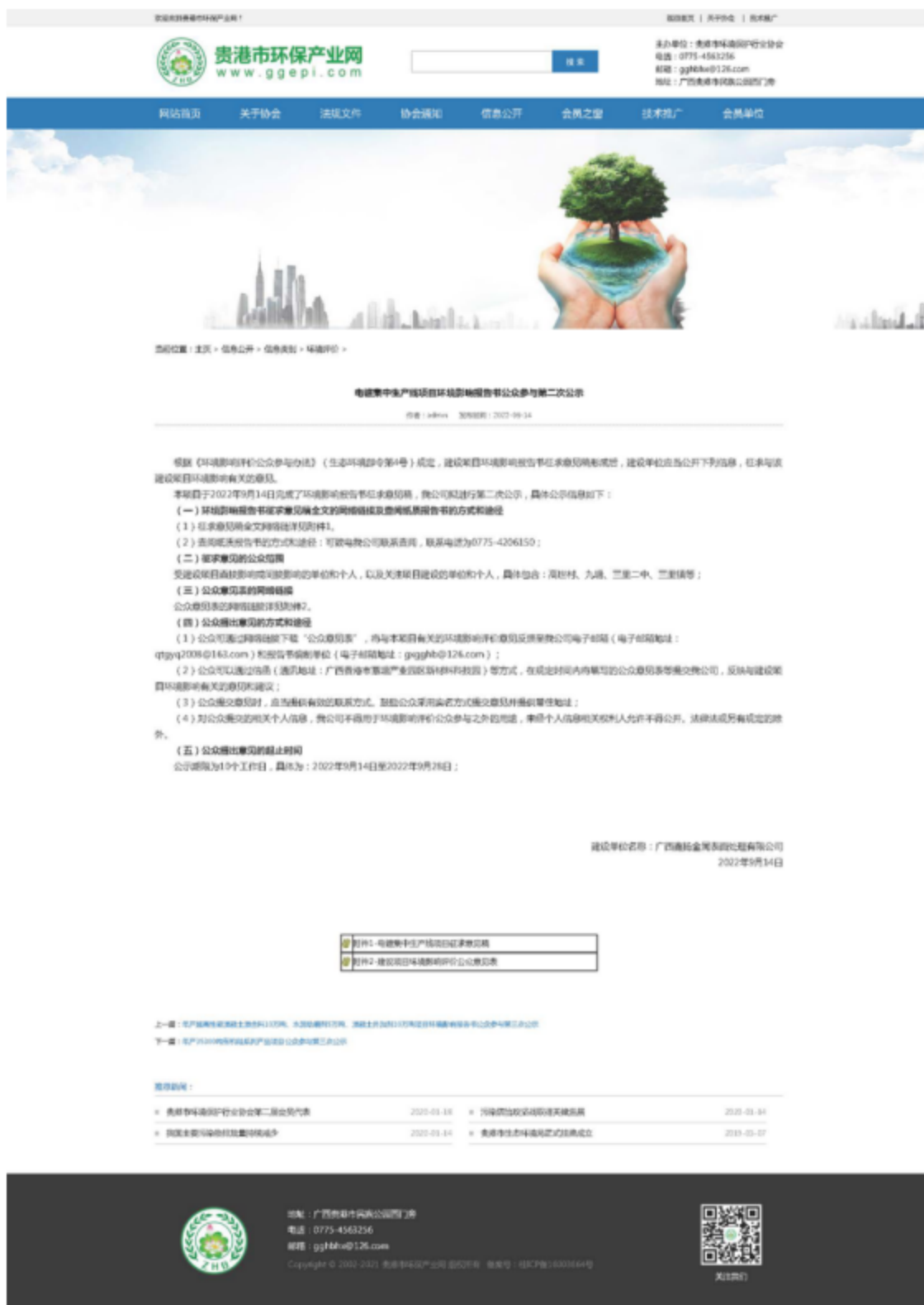
图 3-1 第二次公示——网络公示截图