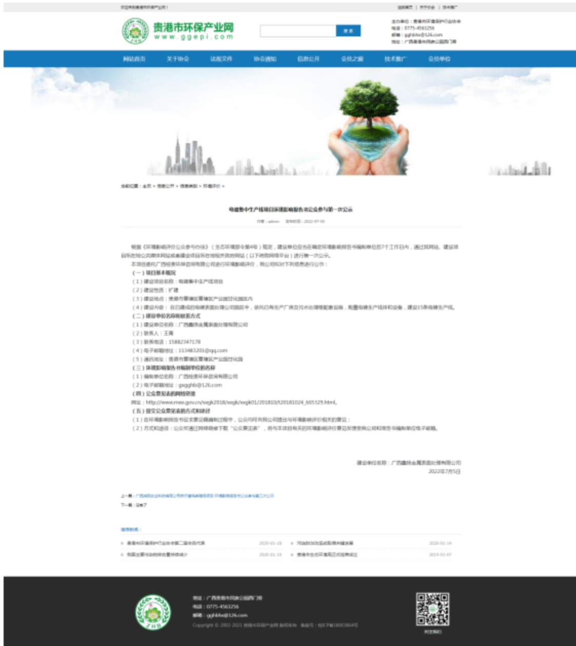
图 2-1 第一次公示——网络公示截图