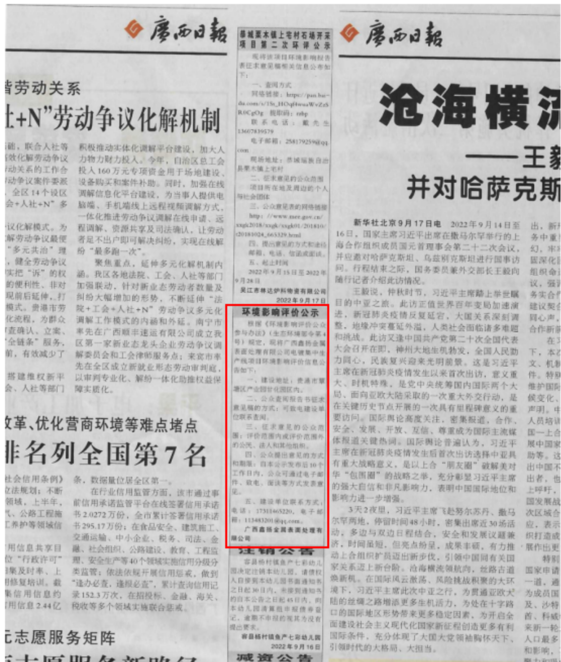
图3-2 第二次公示——报纸公示照片(2022年9月17日广西日报)