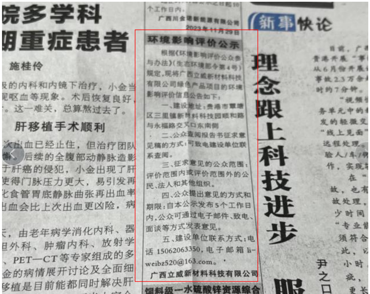
图 3-3 第二次公示——报纸公示照片（2023 年 11 月 29 日广西日报）