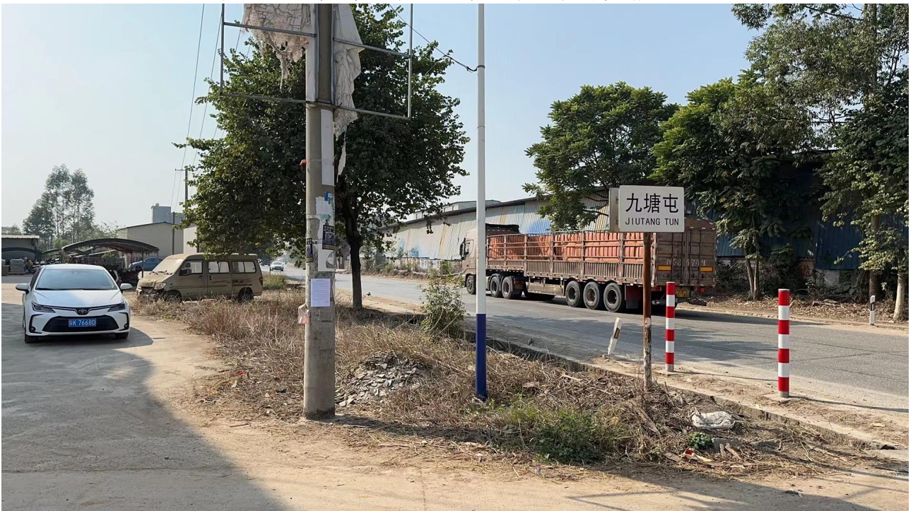
图 3-5 第二次公示——张贴公示照片（九塘屯）