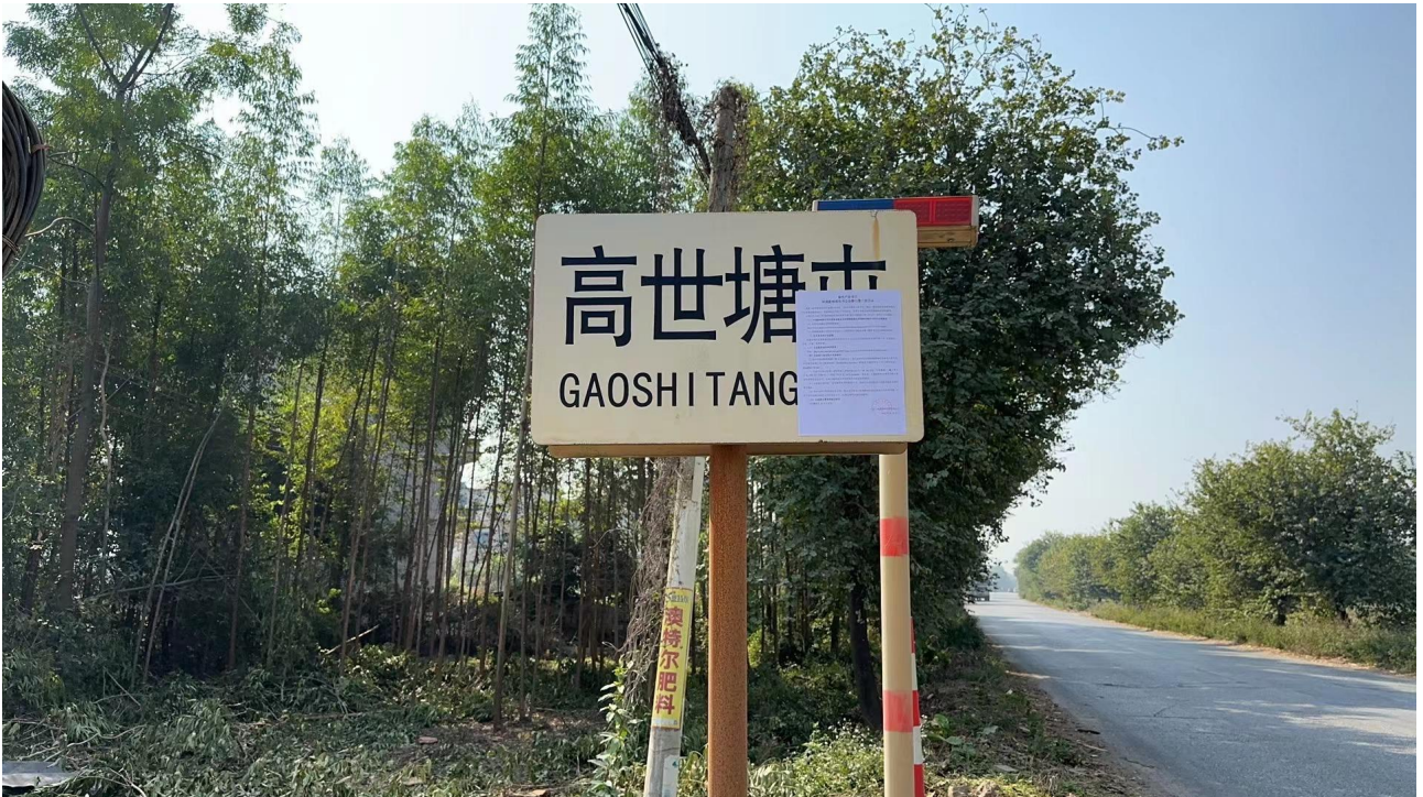
图 3-4 第二次公示——张贴公示照片（高世塘屯）

第二次公示的张贴公告，在项目拟建地周边的、九塘屯、三里二中、自珍屯等地张贴公告。公示照片见图 3-4、图 3-5、图 3-6、图 3-7。