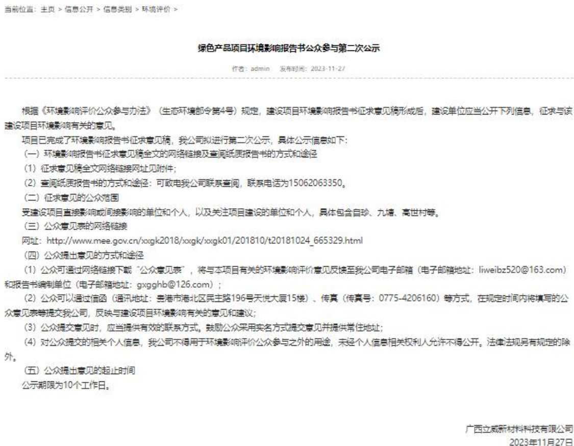
图 3-1 第二次公示——网络公示截图

根据《环境影响评价公众参与办法》（生态环境部令第4号）的要求，本项目的环境影响报告书征求意见稿形成后，我单位在贵港市环保产业网发布了第二次公示，网络公示的网址为 https://www.ggepi.com/a/xinwen/gongsixinwen/huanjingpingjia/2023/1127/1125.html ，网络公示的截图见图 3-1。