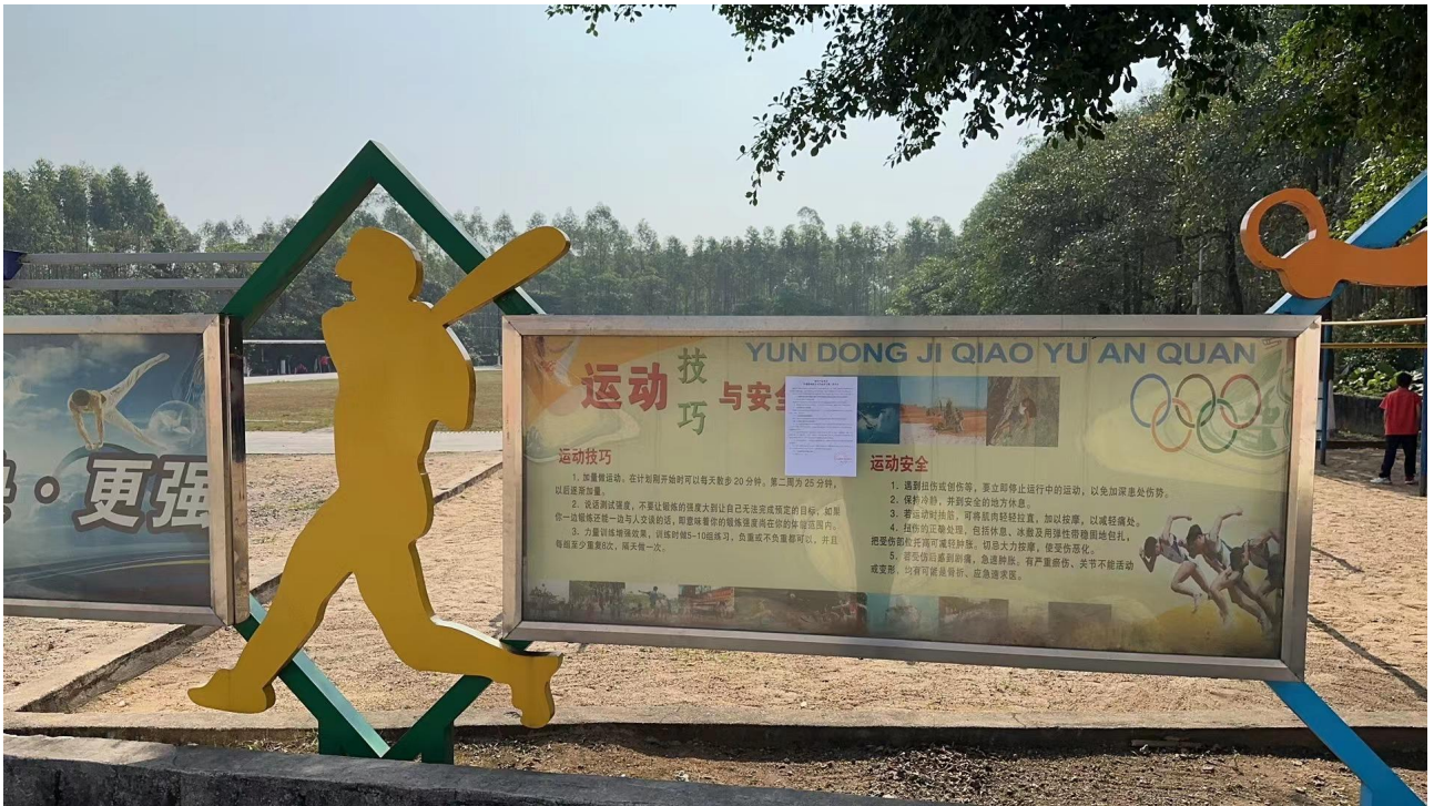
图 3-6 第二次公示——张贴公示照片（三里镇二中）