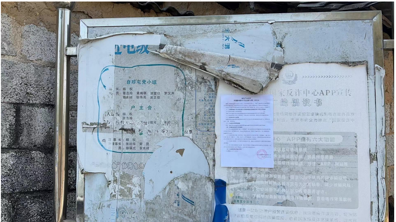
图 3-7 第二次公示——张贴公示照片（自珍屯）