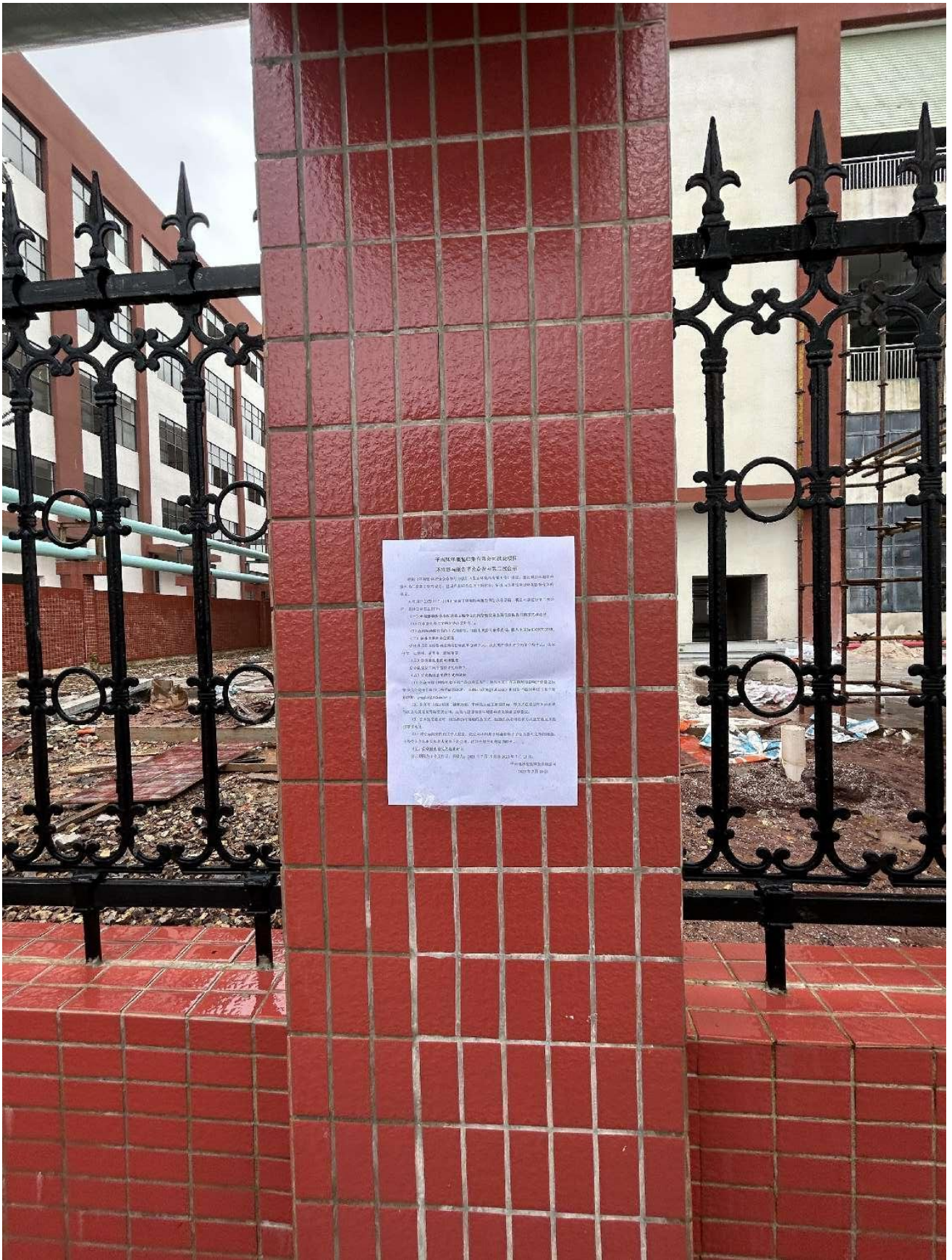
4-1 项目现场张贴公示