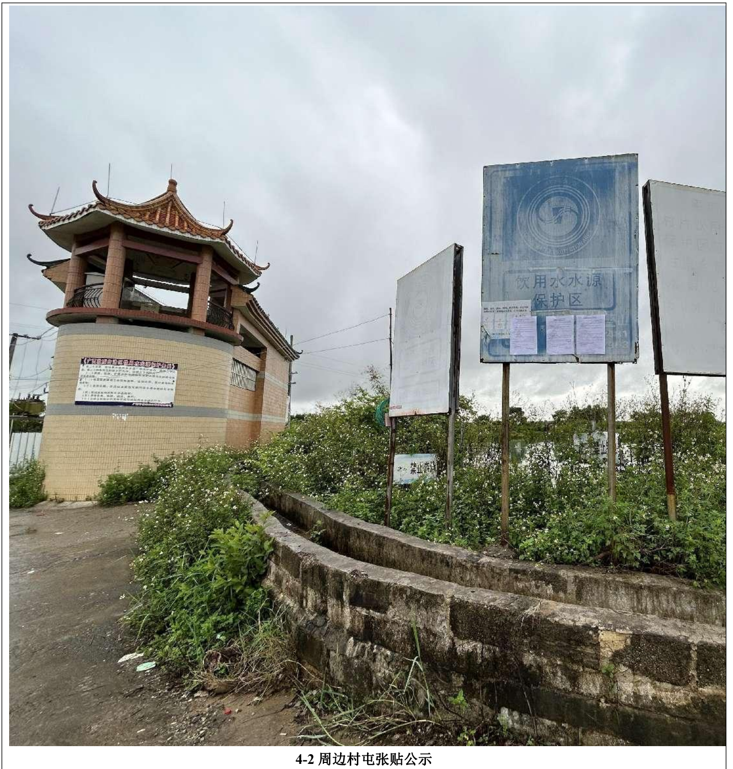
4-2 周边村屯张贴公示