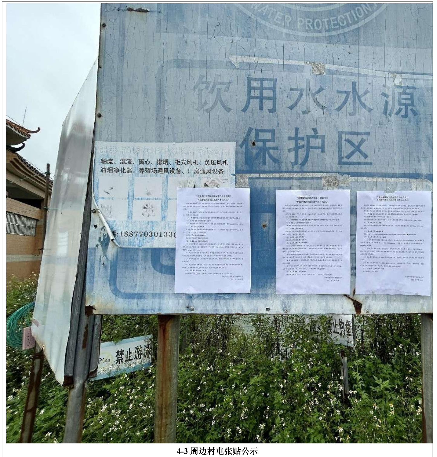
4-3 周边村屯张贴公示