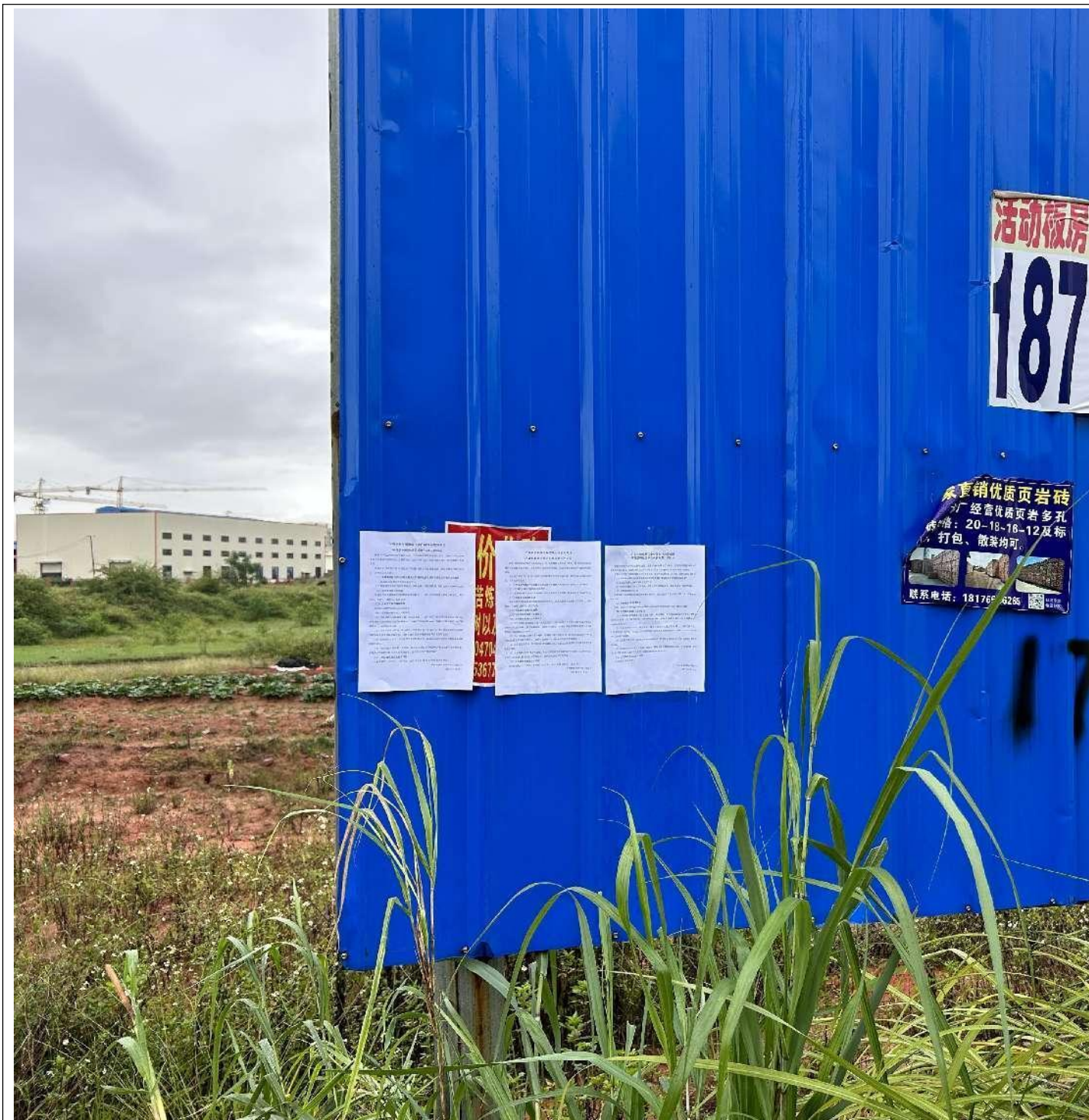
4-2 项目现场张贴公示