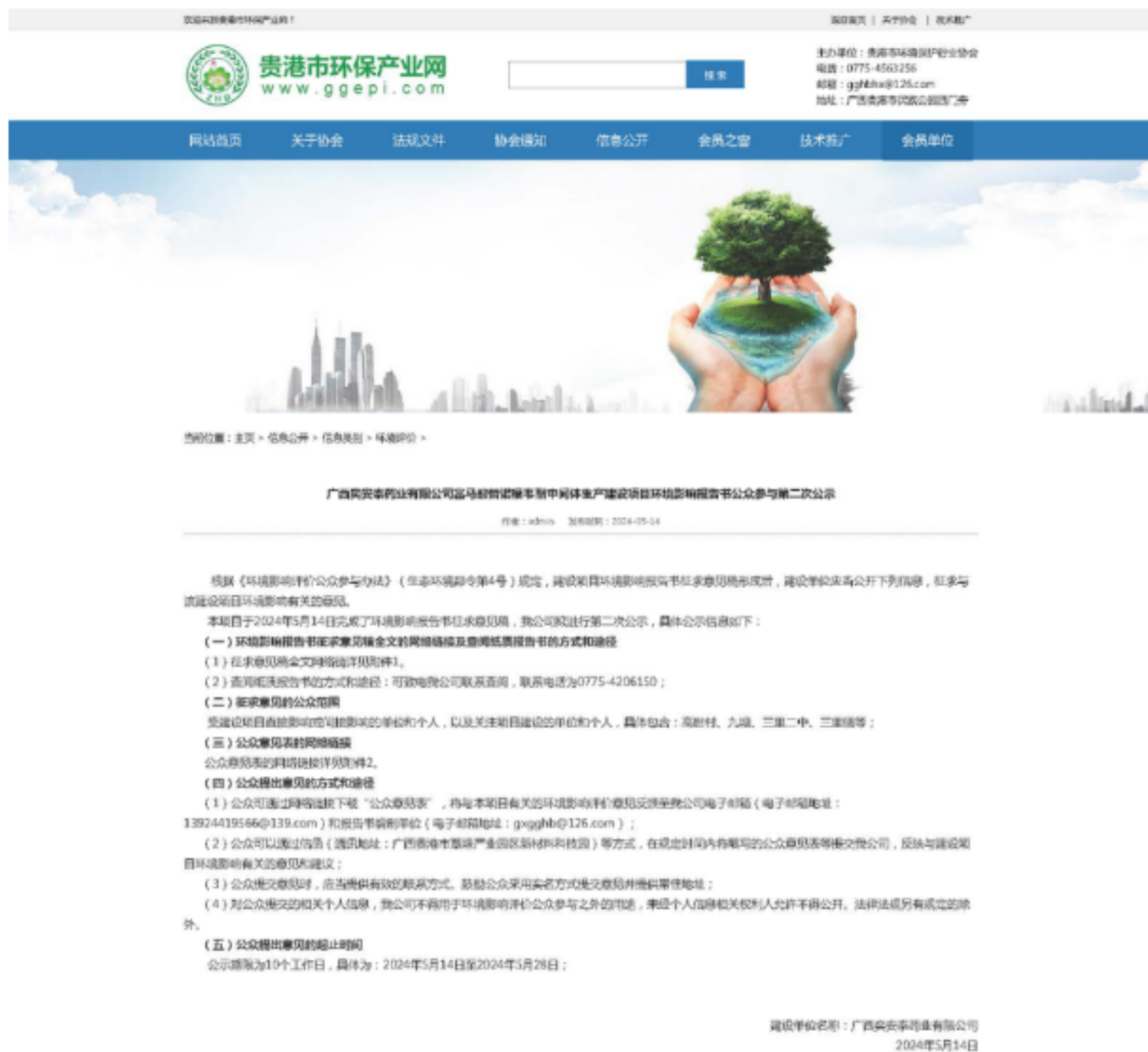
图 3-1 第二次公示——网络公示截图