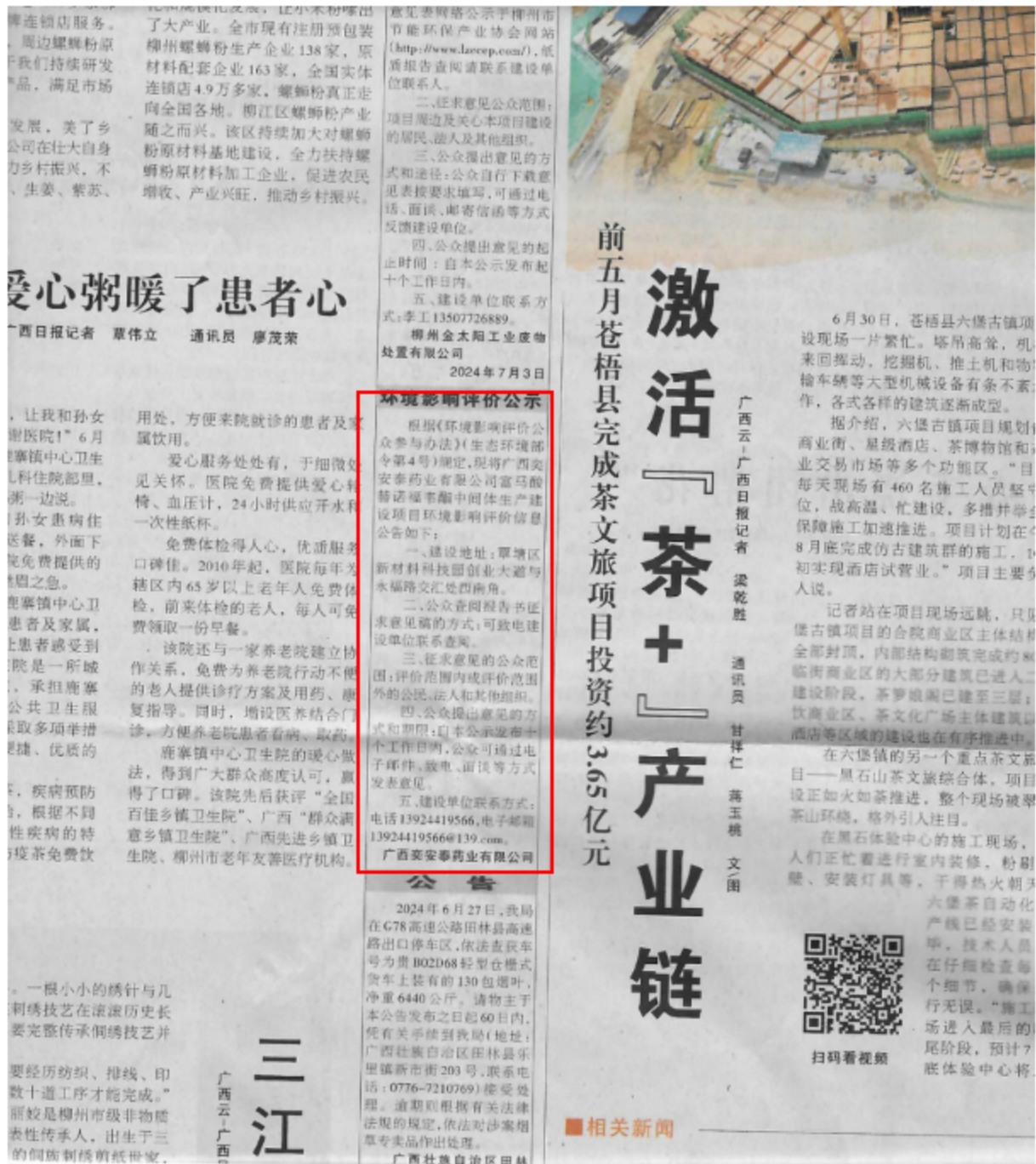
图 3-3 第二次公示——报纸公示照片（2024 年 7 月 3 日广西日报）