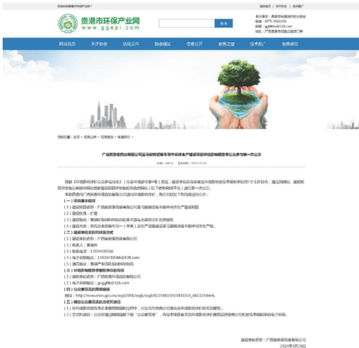
图 2-1 第一次公示——网络公示截图